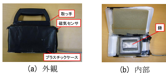
図 2 実物体