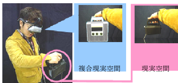
図 1 MR 型視覚刺激の提示

一方、Charpantier は同じ重さであっても大きさが異なると小さい物体を重く感じる”Size-weight illusion”という錯覚現象を報告している 2) 。重心にも同様の錯覚現象が存在し、さらにその影響の程度が既知で、意図的に利用することが可能であれば、CG モデルの変更のみでうまく重量感を提示する方法として活用できると考えられる。