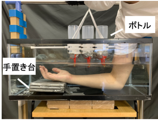
図 1: 温度刺激提示用の装置

実験で提示する温度は、人間の温度受容器の特性を考慮し、設定した。温受容器は、32 度以上 45 度以下で興奮し、冷受容器は 10 度以上、30 度以下で興奮すると言われている [7]。また、高すぎる温度や低すぎる温度は痛覚として認識してしまうことが知られている [8]。これらより、本実験では、温かい刺激を 44 度、冷たい刺激を 11 度とした。この設定温度は装置のボトルに入れる水の温度である。腕に到達するまでに、水槽内の水と混ざり温度が変化するため、事前に著者らが実際に装置を使用し、腕で知覚される温度を確認した。1 箇所のみで一方の温度の刺激を提示した際に、温かい、冷たいが正しく知覚された。また、30 度~36 度の範囲の温度は温かいとも冷たいとも知覚されない無感温度として知られている [9]。そのため水槽内の水の温度は 32 度に設定した。