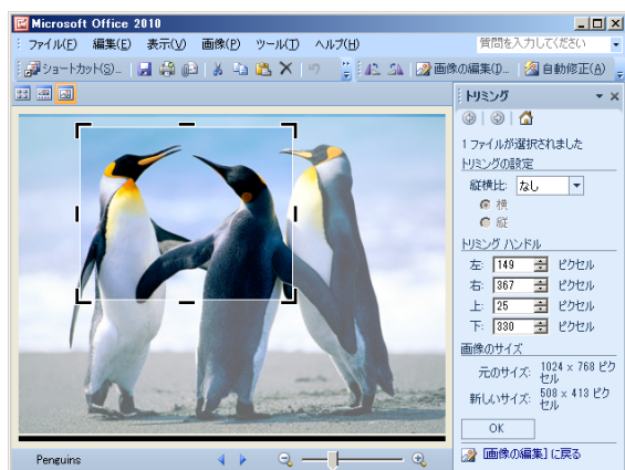
図 7 黒い枠を動かして切り抜きしたい範囲を指定