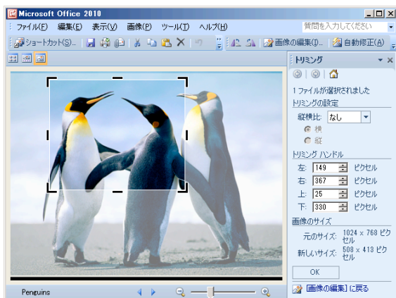
図 7 黒い枠を動かして切り抜きしたい範囲を指定