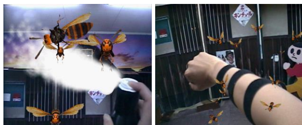
図 2 体験の様子