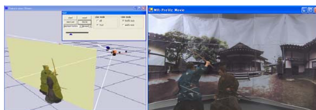
図 2 実行画面

デオ) によるキャラクタの演技とともにカメラの動きとビューボリューム、フォーカス位置を可視化する。