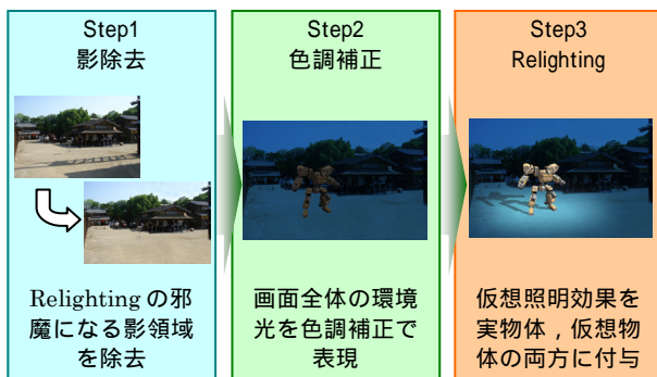
図1 MR-PreVizにおけるRelightingの流れ

ここでいう Relighting とは、MR-PreViz 撮影時に収録した実光景に、仮想光源により意図的に異なった照明効果を付与することを意味している。スタジオ内の撮影では比較的自由に照明を設計できるので、オープンセットやロケ地での撮影で、日照条件がままならない時に大きな威力を発揮する。具体的には図1に示すように MR-PreViz 映像に対して3つの処理を与える。