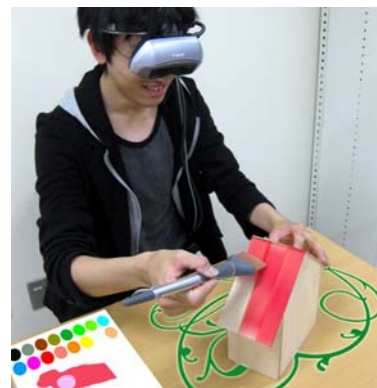
図1 BrushDevice イメージ図

(1) 絵筆の軌跡：実世界の描画において、筆で描く軌跡には太さ、色の濃淡、かすれ、凹凸など様々な特徴がある。まず、これらの中で筆らしい表現のために重要な「線の太さ」に着目した。実世界では、描画対象に筆を押し付けることで線の太さを変更することができる。BrushDevice でも、実世界同様の「線の太さ」を表現するために、以下の 2 つのパラメータをセンシ