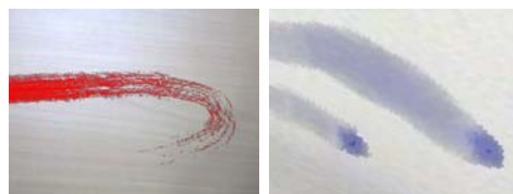
(a) かすれ (b) たまり