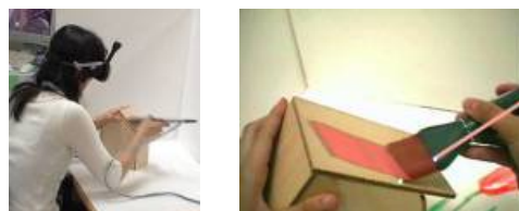
(a) 現実の風景 (b) ユーザが見ている風景