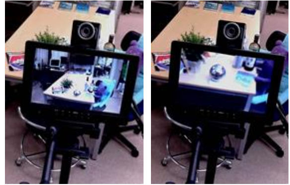
図 1: 通常が表示(左)と視点依存表示(右)

タブレット型 MR の幾何学的整合法の開発が成功し、スクリーン上の実シーンと利用者が直接みる実シーンの幾何学的整合性が解消された提示像(図 1 右)を見て初めて気づいたことは、図 1 のように写真上でみるよりも両者が連続して見えないということであった。前節で説明したシステムでは利用者視点の位置は効き目の位置に設定していたが、スクリーンと実シーンとの間に奥行の違いがあると両眼視と焦点ボケの影響で両者が脳内の像として整合しないことが原因として考えられた。