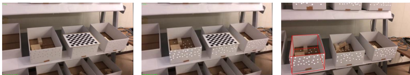
図 3：小片マーカ（左：点灯なし，中央：点灯あり，右：重畳表示結果）