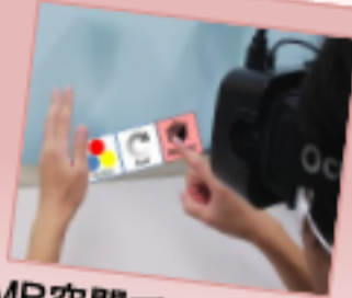
MR空間でのメニュー